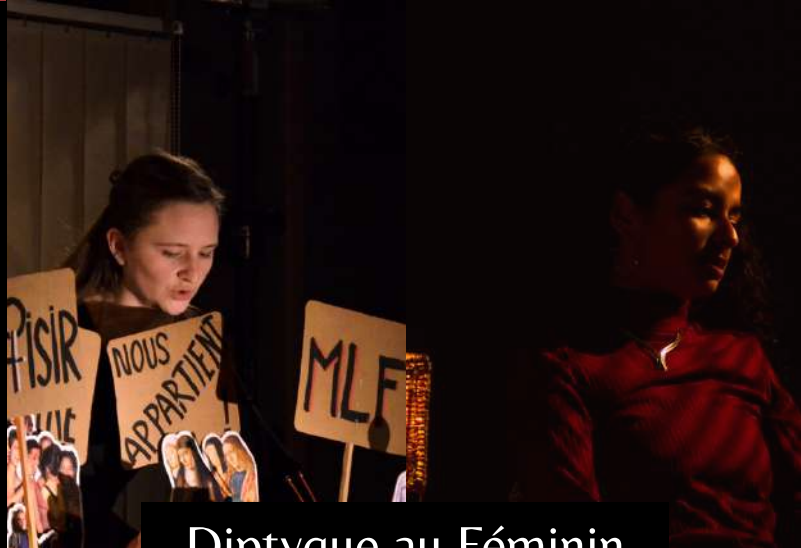
Diptyque au Féminin Simone Veil – Angela Davis